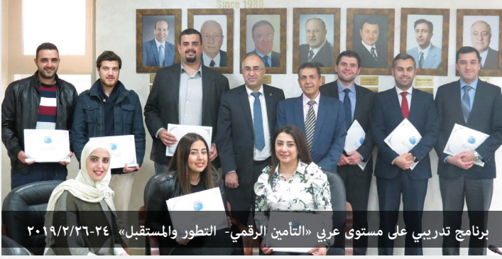
برنامج تدريبي على مستوى عربي «التأمين الرقمي- التطور والمستقبل» ٢٠١٩/٢/٢٦-٢٤