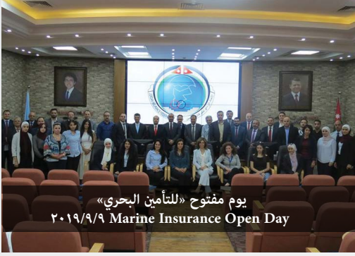
يوم مفتوح «للتأمين البحري» ٢٠١٩/٩/٩ Marine Insurance Open Day