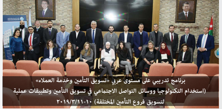
برنامج تدريبي على مستوى عربي «تسويق التأمين وخدمة العملاء» (استخدام التكنولوجيا ووسائل التواصل الاجتماعي في تسويق التأمين وتطبيقات عملية لتسويق فروع التأمين المختلفة) ٢٠١٩/٣/١١-١٠