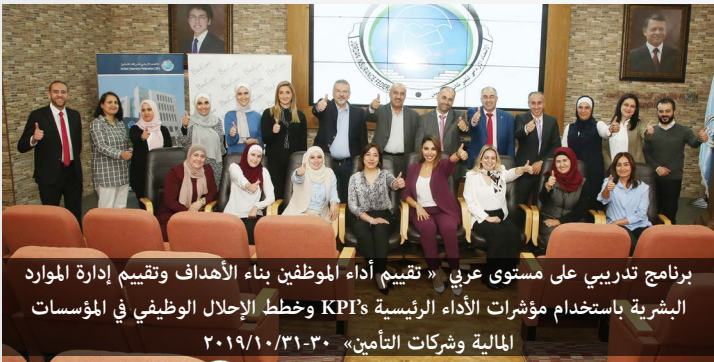
برنامج تدريبي على مستوى عربي «تقييم أداء الموظفين بناء الأهداف وتقييم إدارة الموارد البشرية باستخدام مؤشرات الأداء الرئيسية KPIs وخطط الإحلال الوظيفي في المؤسسات المالية وشركات التأمين» ٢٠١٩/١٠/٣١-٣٠