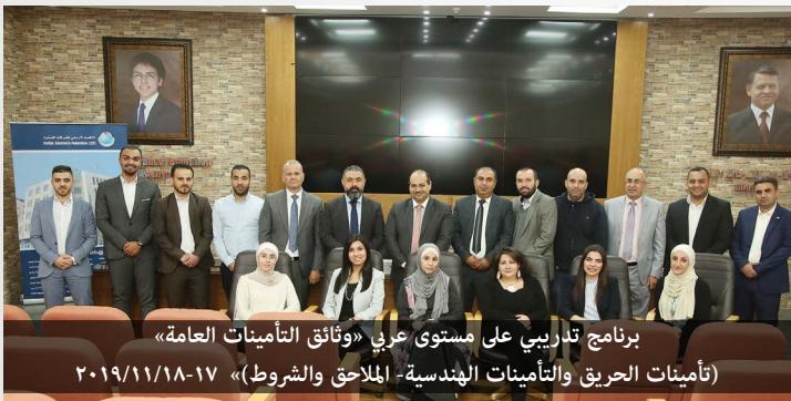
برنامج تدريبي على مستوى عربي «وثائق التأمين العامة» (تأمينات الحريق والتأمينات الهندسية- الملاحق والشروط) ٢٠١٩/١١/١٨-١٧