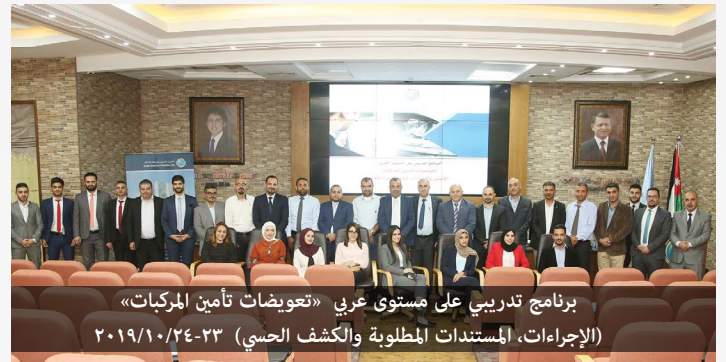
برنامج تدريبي على مستوى عربي «تعويضات تأمين المركبات» (الإجراءات، المستندات المطلوبة والكشف الحسي) ٢٠١٩/١٠/٢٤-٢٣