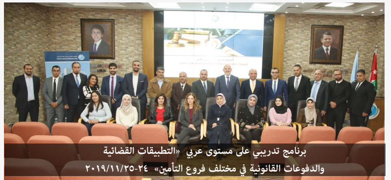
برنامج تدريبي على مستوى عربي «التطبيقات القضائية والدفعات القانونية في مختلف فروع التأمين» ٢٠١٩/١١/٢٥-٢٤