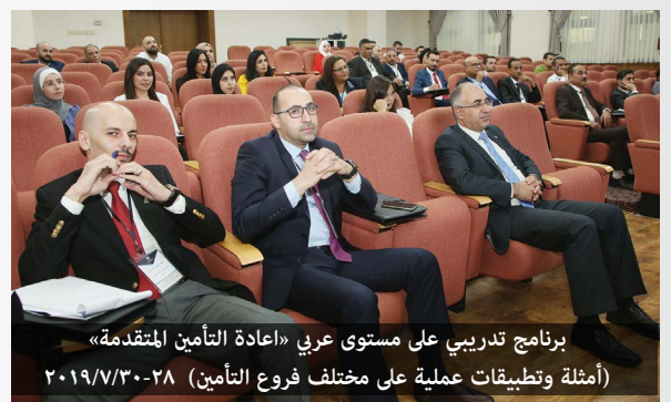
برنامج تدريبي على مستوى عربي «إعادة التأمين المتقدمة» (أمثلة وتطبيقات عملية على مختلف فروع التأمين) ٢٠١٩/٧/٣٠-٢٨