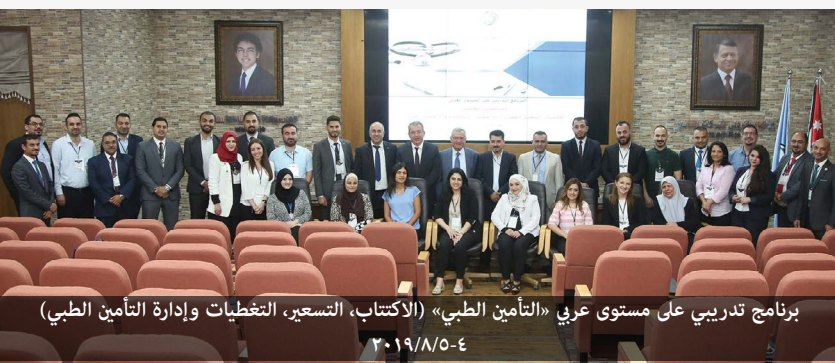
برنامج تدريبي على مستوى عربي «التأمين الطبي» (الاكتتاب، التسعير، التغطيات وإدارة التأمين الطبي) ٢٠١٩/٨/٥-٤