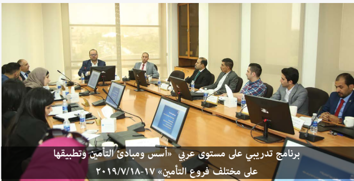
برنامج تدريبي على مستوى عربي «أسس ومبادئ التأمين وتطبيقها على مختلف فروع التأمين» ٢٠١٩/٧/١٨-١٧