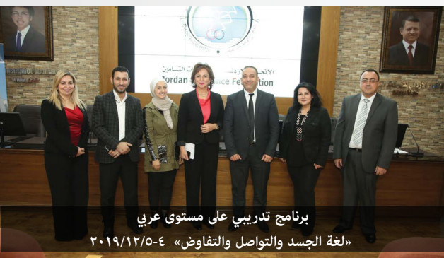
برنامج تدريبي على مستوى عربي «لغة الجسد والتواصل والتفاوض» ٢٠١٩/١٢/٥-٤