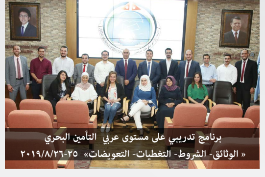
برنامج تدريبي على مستوى عربي التأمين البحري «الوثائق- الشروط- التغطيات- التعويضات» ٢٠١٩/٨/٢٦-٢٥