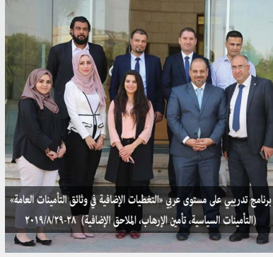
برنامج تدريبي على مستوى عربي «التغطيات الإضافية في وثائق التأمين العامة» (التأمينات السياسية، تأمين الإرهاب، الملاحق الإضافية) ٢٠١٩/٨/٢٩-٢٨