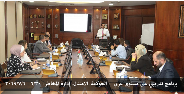
برنامج تدريبي على مستوى عربي «الحوكمة، الامتثال، إدارة المخاطر» ٢٠١٩/٧/١ - ٦/٣٠