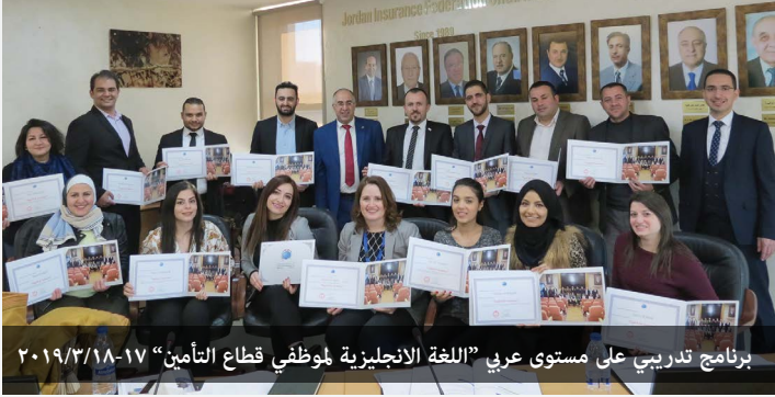
برنامج تدريبي على مستوى عربي «اللغة الانجليزية لموظفي قطاع التأمين» ٢٠١٩/٣/١٨-١٧