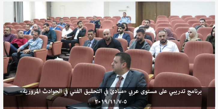
برنامج تدريبي على مستوى عربي «مبادئ في التحقيق الفني في الحوادث المبرورية» ٢٠١٩/١١/٧-٥