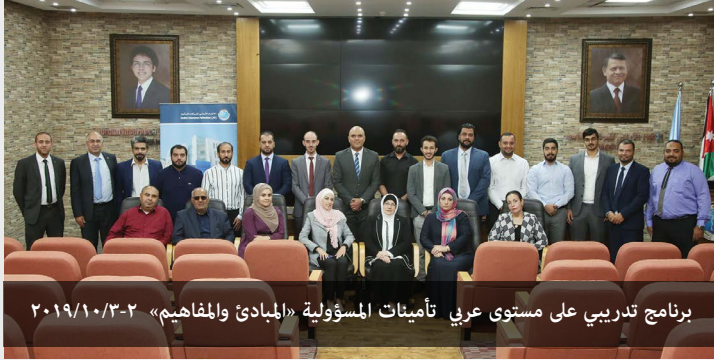
برنامج تدريبي على مستوى عربي تأمينات المسؤولية «المبادئ والمفاهيم» ٢٠١٩/١٠/٣-٢