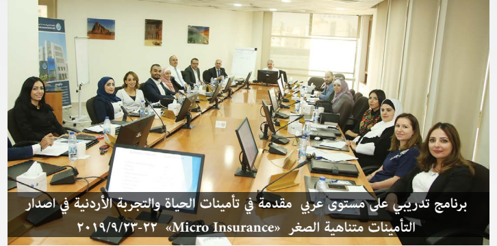
برنامج تدريبي على مستوى عربي مقدمة في تأمينات الحياة والتجربة الأردنية في اصدار التأمينات متناهية الصغر «Micro Insurance» ٢٠١٩/٩/٢٣-٢٢