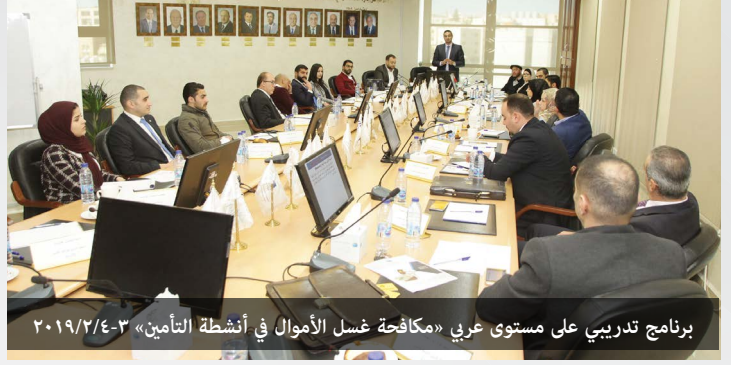
برنامج تدريبي على مستوى عربي «مكافحة غسل الأموال في أنشطة التأمين» ٢٠١٩/٢/٤-٣