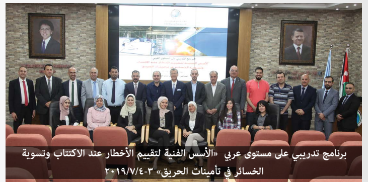
برنامج تدريبي على مستوى عربي «الأسس الفنية لتقييم الأخطار عند الاكتتاب وتسوية الخسائر في تأمينات الحريق» ٢٠١٩/٧/٤-٣